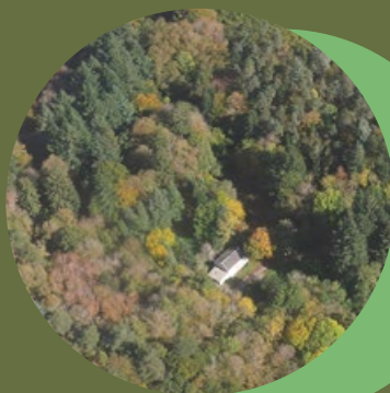
Site de Coumbo Falgouzo