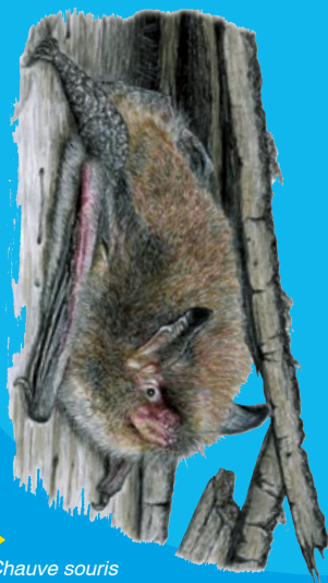
► Chauve souris Grand murin - Myotis Myotis

La chauve-souris est un animal nocturne qui se cache en journée. Les diverses espèces cherchent abri dans des cavités naturelles ou minières, des fissures et anfractuosités de falaises, des fissures et anfractuosités de falaises, des écorces décollées, des arbres creux, dans des granges et vieilles bâtisses où elles ne seront pas dérangées et peuvent passer inaperçues.