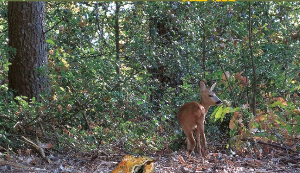
Forêt de la Montagne Noire