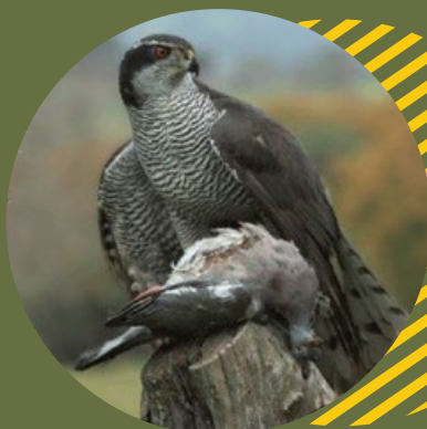
Autour des palombes